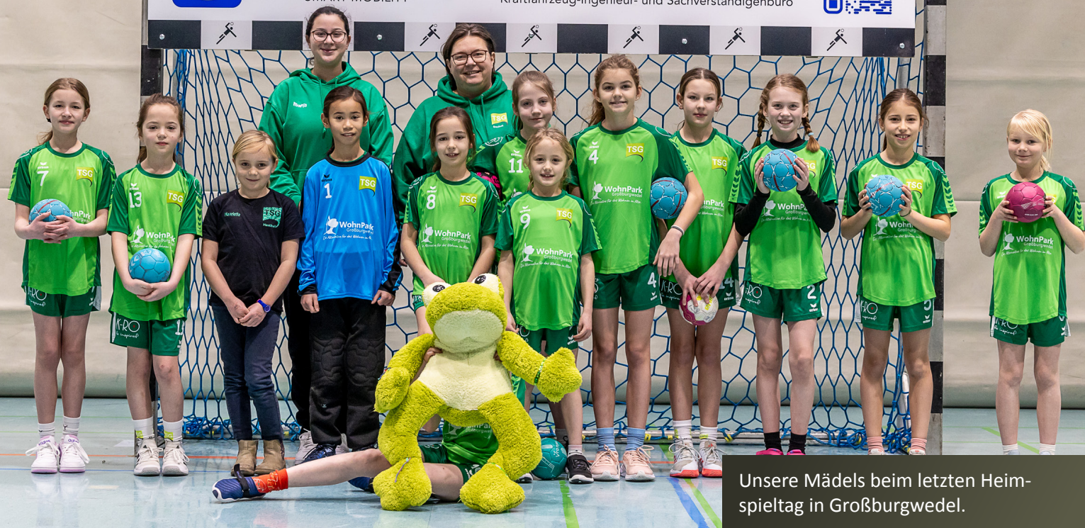
Unsere Mädels beim letzten Heimspieltag in Großburgwedel.

Schon als Papa hat es mir immer richtig Spaß gemacht, dabei zu sein.