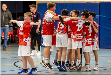
Die Jungs freuen sich über den ersten Sieg im Turnier gegen Nordmazedonien...