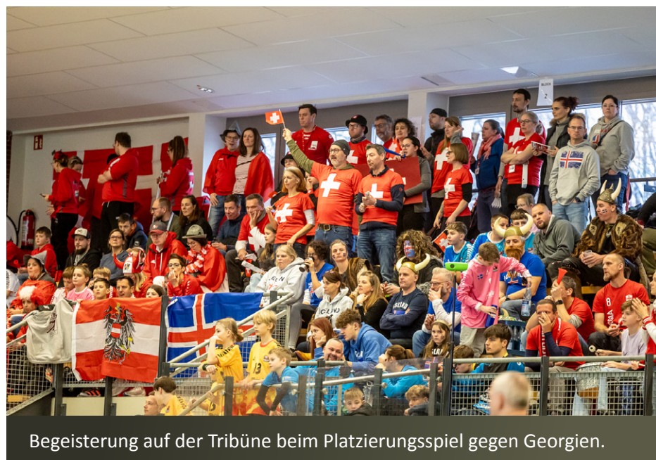
Begeisterung auf der Tribüne beim Platzierungsspiel gegen Georgien.

auch in der Hauptrunde zählten, wurde so das Spiel gegen Österreich erneut zum Entscheidungsspiel um ein Hintertürchen für das Viertelfinale. Es war wieder spannend bis zur letzten Sekunde, diesmal mit dem besseren Ende für unser Team! Mit lautstarker Unterstützung von der Tribüne, Schweizer Glocken und Schlachtrufe schallten von den Rängen, und dank einer starken Abwehrleistung und einem überragendem Torwart Teo hieß