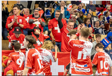
... und bedanken sich bei den Schweizer Fans.