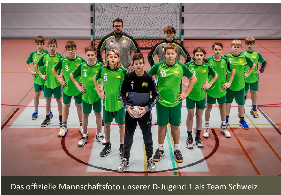
Das offizielle Mannschaftsfoto unserer D-Jugend 1 als Team Schweiz.

Jetzt hieß es diese positive Energie ins letzte und entscheidende Gruppenspiel gegen Deutschland (VfL Tegel Berlin) mitzunehmen. Direkt mit dem Anpfiff war man hellwach und präsent. Die Abwehr stand sicher und