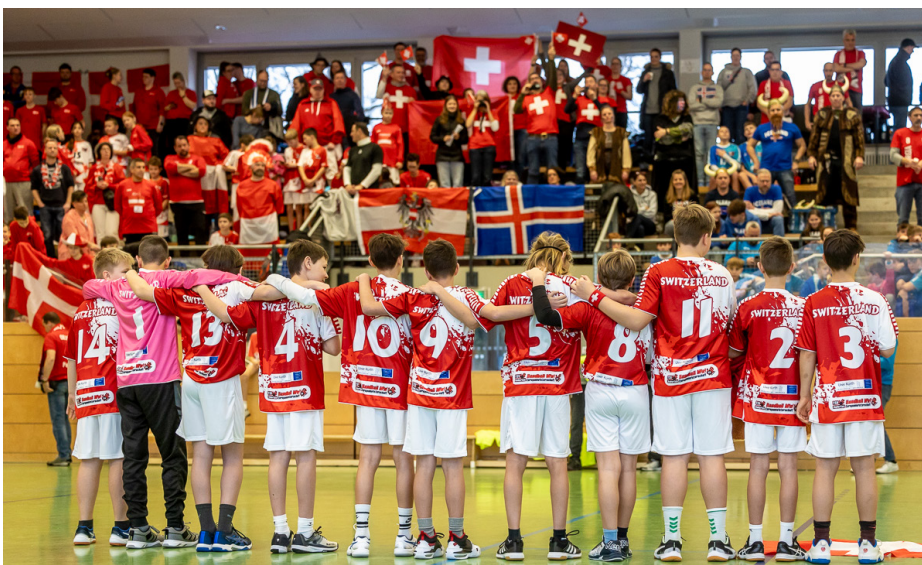
Unsere Jungs genießen die Atmosphäre beim Abspielen der Nationalhymnen vor der ersten Begegnung der abschließenden Platzierungsrunde gegen Georgien.

Auch für den Zusammenhalt der Mannschaft waren es zwei tolle Tage. Es war schön zu sehen, wie die Jungs die Stimmung der Tage regelrecht aufsaugten, sich gegenseitig anfeuerten, Siege zusammen feierten und sich auch von Niederlagen nicht entmutigen ließen. „Das hat super viel Spaß gemacht“, waren sich alle einig. ■ von Gustavo Martinez und Thomas Hövetborn