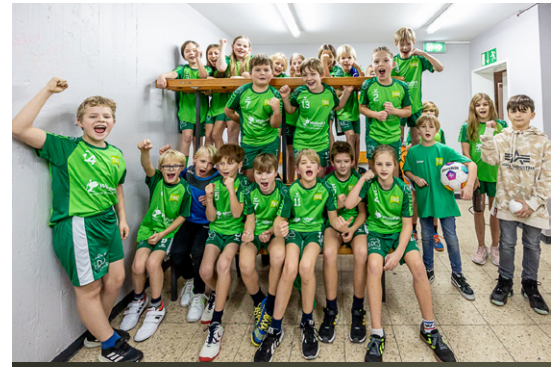
Die E-Jugend-Kids waren als Einlaufkinder beim letzten Spiel des HHB im Jahr 2023 dabei.

Yvonne: Wir beobachten auch, dass die Kinder mit Ihren Eltern inzwischen auch weitere Wege in Kauf nehmen. Die Kinder kommen nicht mehr nur