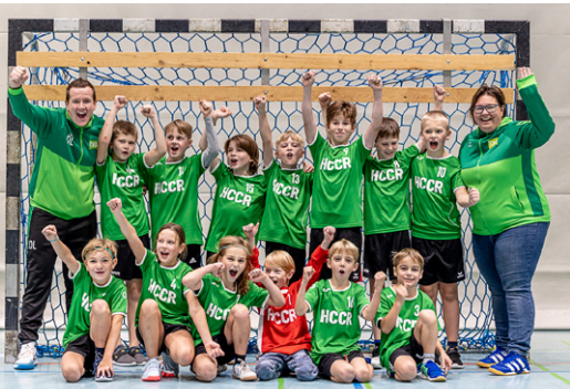
Die noch gemischte E-Jugend zum Ende der letzten Saison.