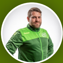
Abteilung Handball der Turnerschaft Großburgwedel e.V.

Geschäftsstelle der TSG Hannoversche Str. 51 30938 Großburgwedel