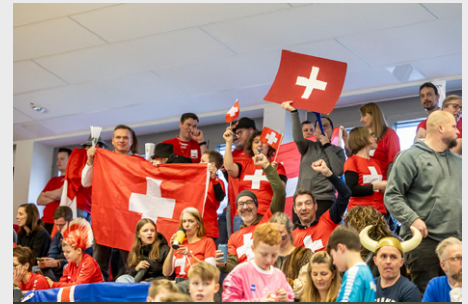
Die Schweizer Ultras feiern ihr Team an.